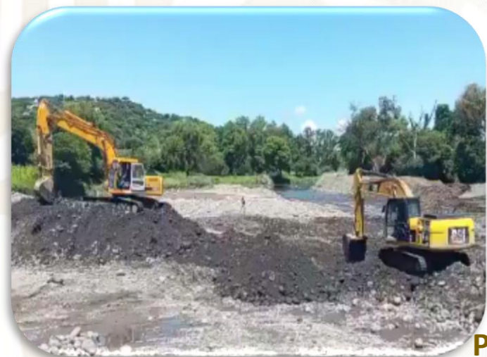
Presa Derivadora San Esteban Ayala, Morelos